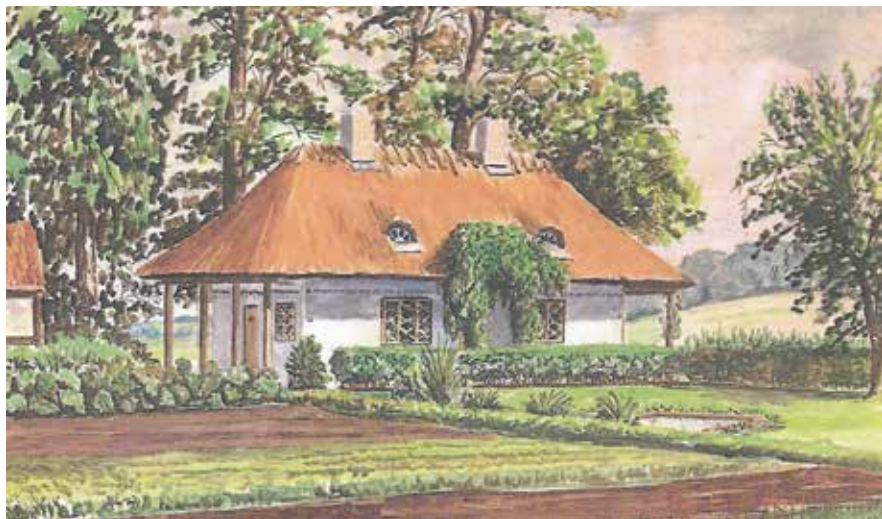
Louisenlund. Akvarel malet af Jørgen Luplau Janssen

Kørevejen dertil gik fra Åstrup Allé over åen, og den findes stadigvæk. På den anden side fra Kvarmløsevejen var der også en kørevej, der førte forbi det nu nedlagte Aastrup Kalkværk. Navnet Louisenlund er nu snart gået i glemmebogen, lige såvel som mange ikke længe ved, at der lå et kalkværk ikke