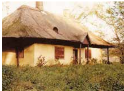
Louisenlund lige inden nedrivning

Derved var polemikken om Louisenlund for alvor kommet i gang, og det hele eskalerede i et brev fra Egnshistorisk Forening til Justitsministeriet om Aastrup Stifts manglende vedligeholdelse af de forskellige bygninger og krænkelse af de testamentariske bestemmelser 5 . Desværre kom det særlige Bygningssyn under Planstyrelsen til den konklusion, at bygningen ikke var bevaringsværdig. 'Den havde ikke tilstrækkelige arkitektoniske og kulturhistoriske værdier', mente man den gang. Fredningsstyrelsen opfordrede Aastrup til alligevel om muligt at bevare Louisenlund 6 . Stiftet kunne dog ikke skaffe de fornødne midler til istandsættelse og beboeliggørelse, som blev anslået til dkr. 750.000. Det var mange