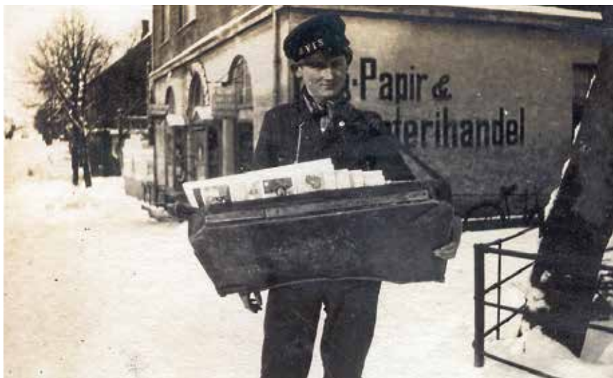
Boghandlens avisbud på vej til Stationen