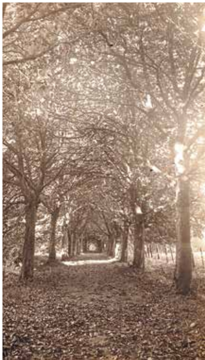
Kastaniealléen ved Aastrup

Schweizerhytten ved Liselund Lystslot er fra 1792. Den tjente som bolig for gartneren eller tilsynsmanden, og ovenpå var der gæsteværelser. En overgang i 1800-tallet fungerede den som gæstgiveri. Generalens Hus og Liselund Lystslot med tilhørende Schweizerhytte tilskrives samme arkitekt: Andreas Kirkerup (9. ju-