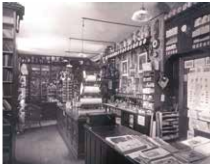
Interiør fra boghandlen på Tølløsevej 4