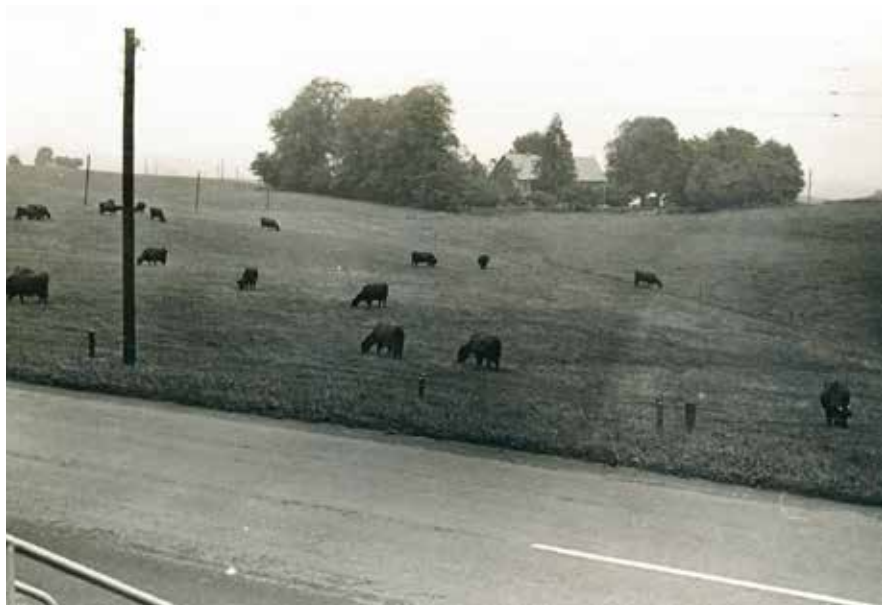
Græssende køer ved Ordrup: udsigt fra Ringstedvej mod Stenhallervej