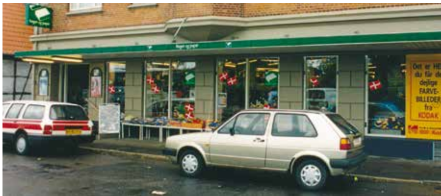
Tølløse Bøger & Papir, Jernbanevej 16